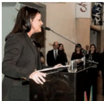
▲ L'honorable Suzanne Côté, juge à la Cour suprême du Canada, présidente d'honneur